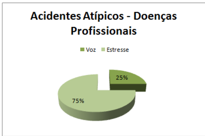
Figura 3. Relação de acidentes atípicos ou doenças profissionais de professores da Educação Básica distribuídos nas escolas da Rede Estadual de Ensino na zona urbana de Montes Claros – MG.